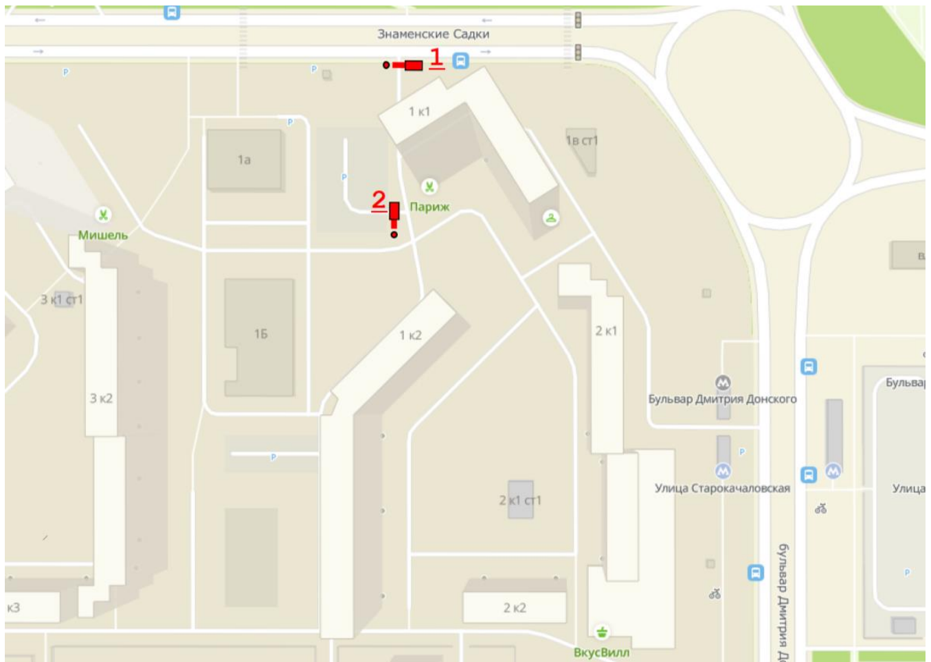
Схема размещения шлагбаумов:

1. Место размещения шлагбаумов: г. Москва, ул. Знаменские Садки д.1 корп.1, при въезде на придомовую территорию.